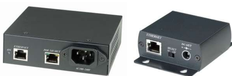
Рис.1 Внешний вид инжектора IP05I и сплиттера IP05S.