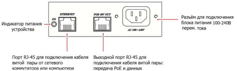
Рис.3 Разъёмы инжектора IP05I.