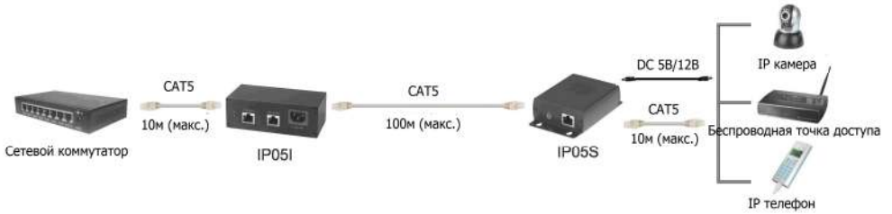
Рис.2 Схема подключения инжектора IP05I и сплиттера IP05S.